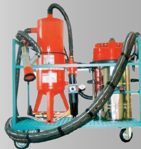
DINO Junior I