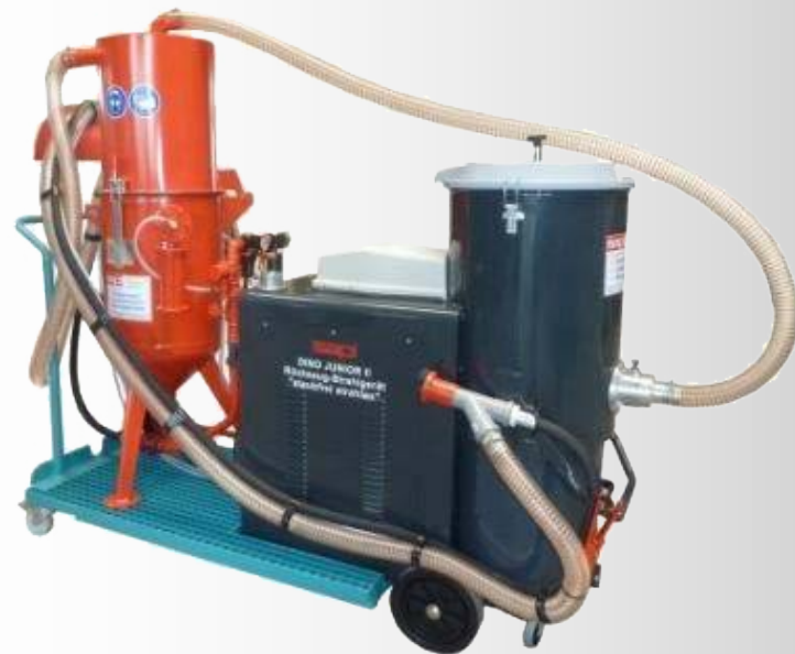
DINO Junior II

В работе они создают очень мало пыли и поэтому могут применяться в невентилируемых помещениях.